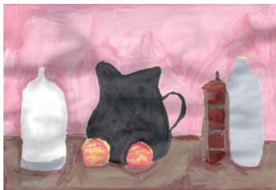
Tiana Čeh, 5. a