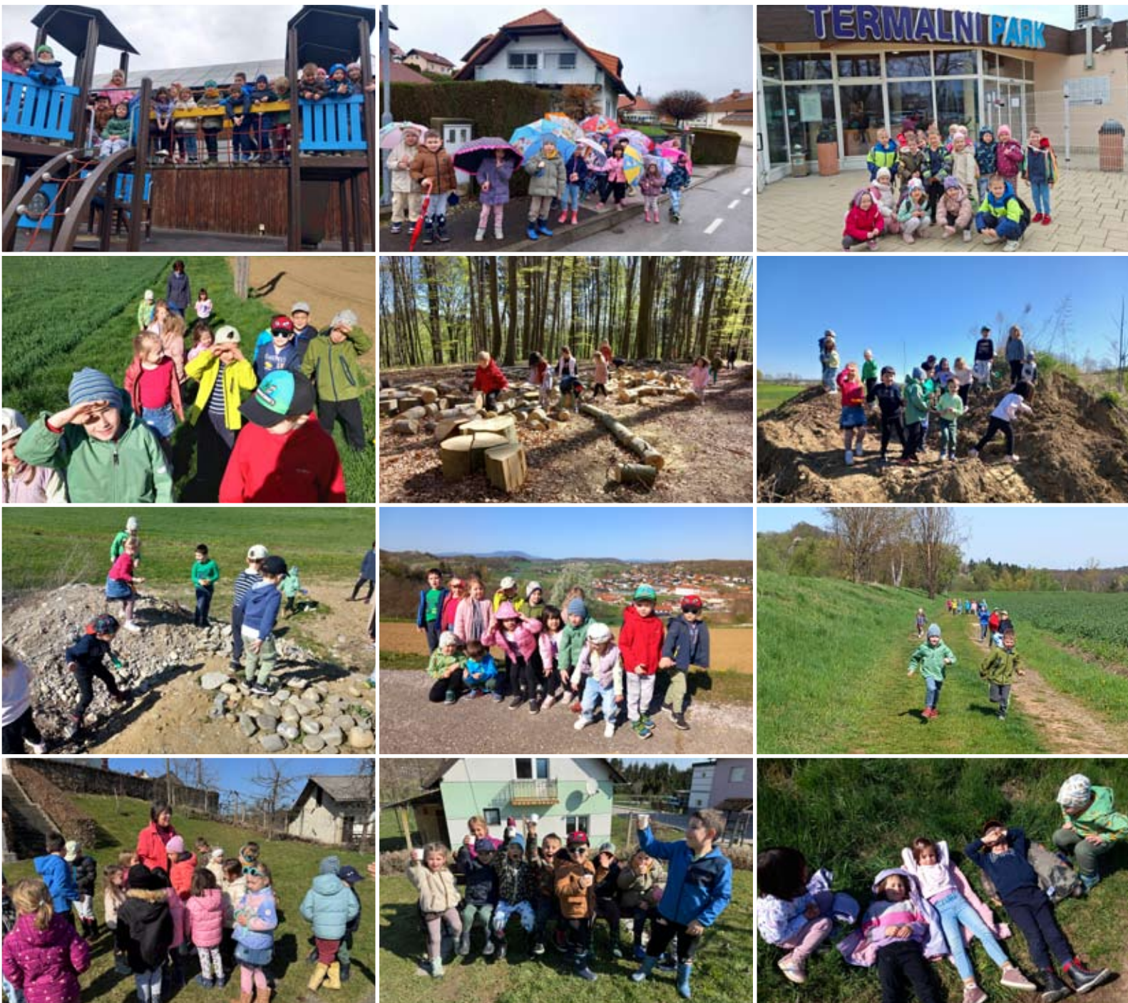
Otroci in vzgojiteljice skupine Utrinki

Predšolski otroci smo razvijali tudi plavalne veščine in pogumno zaplavali.