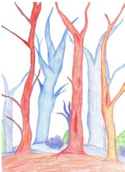
Iva Cerovšek, 9. a