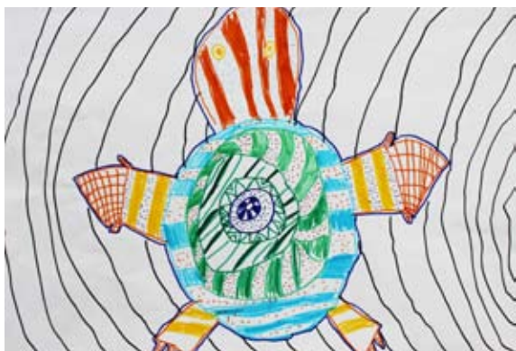
Lovro Kranvogel, 2. a